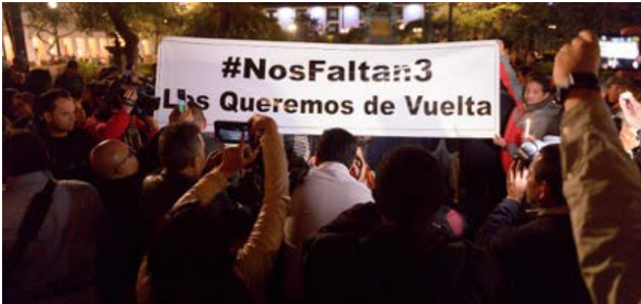
Figura 1. #NosFaltan3 / Los queremos de vuelta