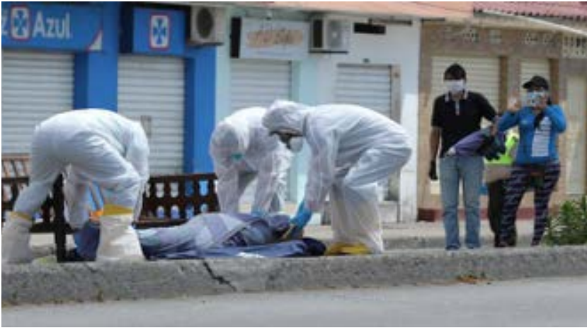
Figura 3. Pandemia, Guayaquil

dor particularmente a la ciudad portuaria de Guayaquil, puso a prueba al periodismo por dos razones.